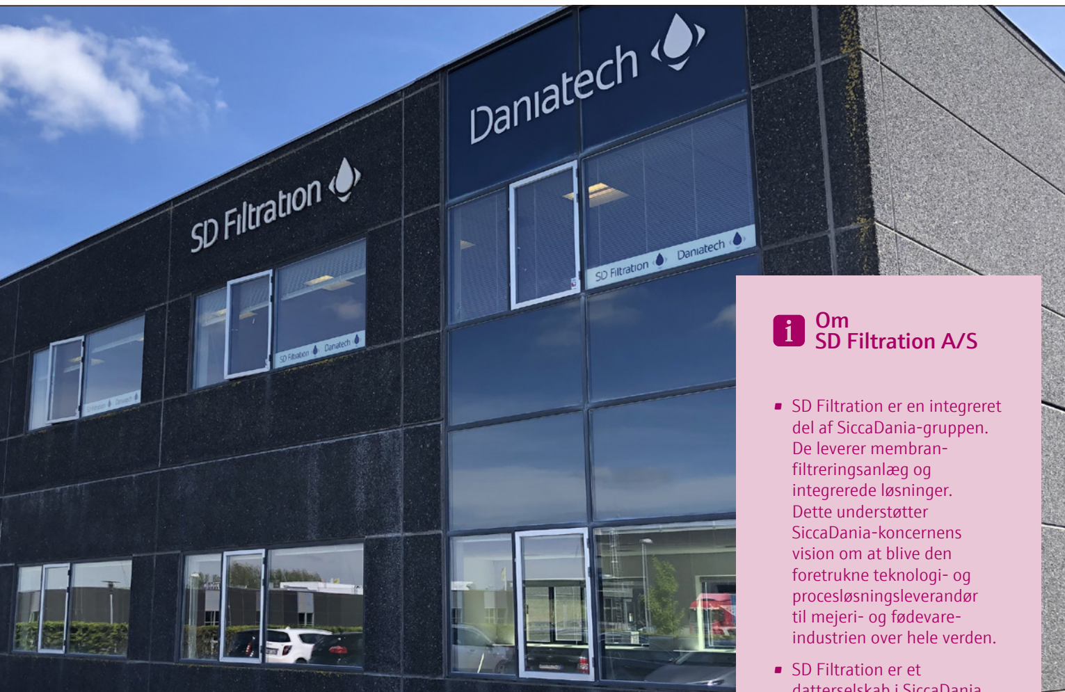
SD Filtration ligger i Skanderborg tæt ved motorvejen.

ønsker om hvilke instrumenter der skal leveres sammen, om hun ønsker en samlet leverance eller om delleverance måske foretrækkes. Online shoppens giver et samlet overblik over alle transaktioner, uanset om det er foregået online